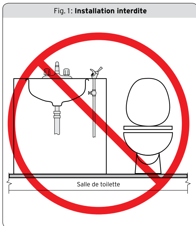
Fig. 1: Installation interdite

L'intention de cet article est de réduire la probabilité qu'un gicleur de fontaine d'eau potable soit installé à un endroit où il serait sujet à la contamination, comme par exemple au-dessus d'un lavabo. Ces gicleurs installés sur d'autres appareils sanitaires pourraient être exposés à des éclaboussures qui risqueraient de contaminer le jet du gicleur et, par le fait même, causer des risques pour la santé de l'utilisateur.